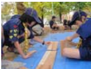
のこぎりを使う真剣な表情