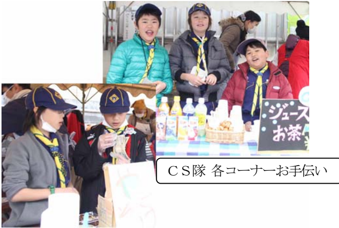
CS隊 各コーナーお手伝い