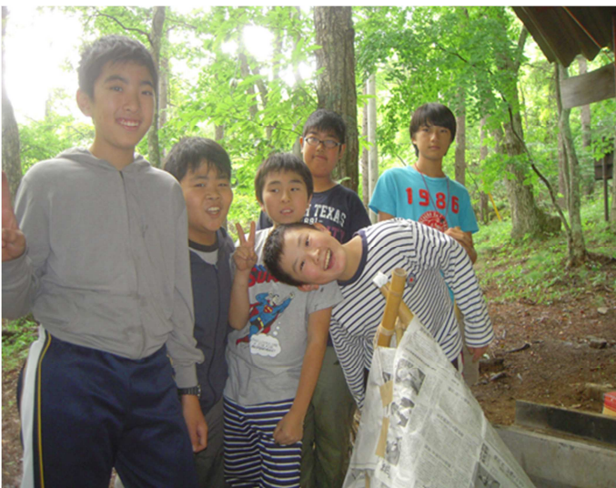
写真11) できあがった燻製用ピーティの前で記念写真