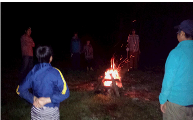
写真12) キャンプファイヤ YouTubeで流行っているゲームをしましたが、これが難しい。

最後の夜はキャンプファイヤ。スカウト達がそれぞれ新組や司会者、ソングマスター、ゲームマスターなどそれぞれの役割を果たしてキャンプファイヤを進めていきました。昨年9月に上進したスカウトたちが乗りまくったスタンプはアドリブがバンバン出て大笑いでした。