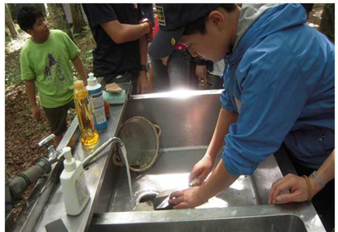
写真5) 砥石を使って切れ味が悪くなった包丁を研ぐIスカウト