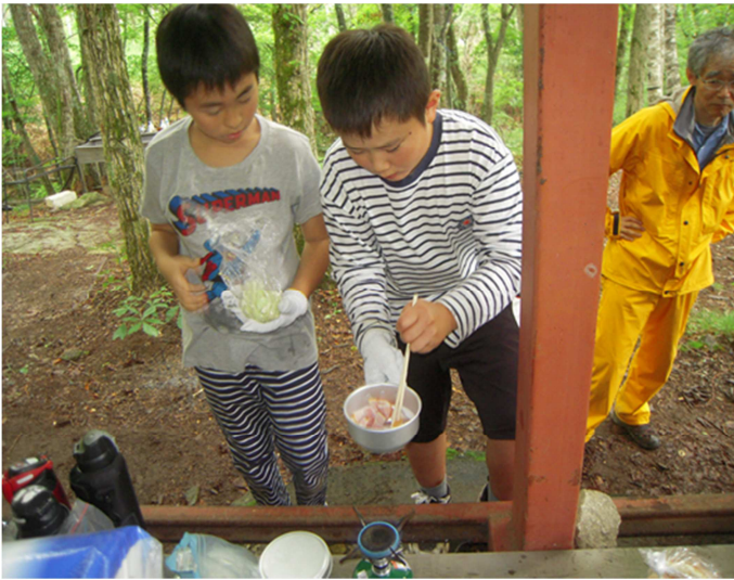
写真10) ガスバーナーで料理に取り組むAスカウトとNスカウト

撤営に手間取り、バスに乗り遅れないように大急ぎでキャンプ場を出発したスカウト達は、電車を乗り継ぎ無事第4公園に到着。全日程を終えたスカウト達には優秀スカウト賞やサバイバル賞を授与されました。セレモニーが終わった後、みんなで荷物を倉庫に片づけました。本当にお疲れさまでした。