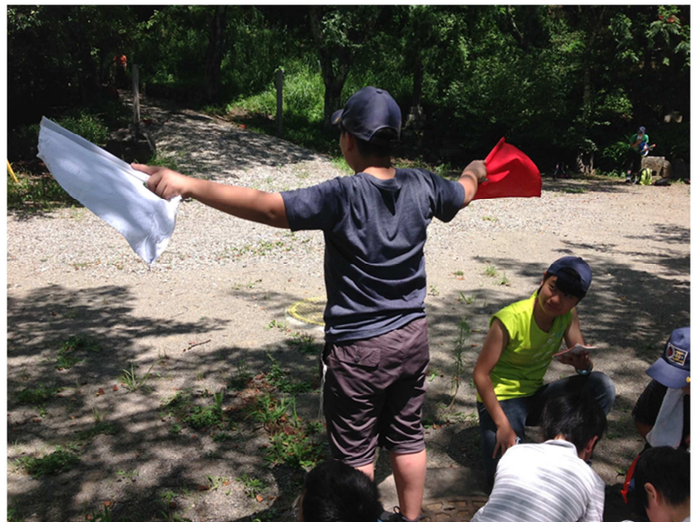
写真9) 課題の文を送信するWスカウト

登山の予定日はあいにく天候が悪く、キャンプサイトでの活動に変更。山の上で料理する予定で持ってきたカートリッジ式ガスバーナーでベーコンとキャベツの炒め物を作り、ロールパンで挟む昼食を作ってみました。おいしくできてスカウト達には好評でした。また、竹で作った三角錐を新聞紙で覆ってスモーク室を作り、春キャンプに続き燻製を作ってみました。もっと濃く香り付けをしたかったところですが、おいしく出来上がりをいただきました。