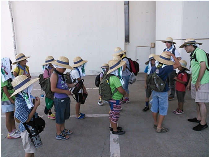
麦わら隊の誕生です。海岸へ移動して、リーダーから説明を受けます。

お昼を食べて、ハイク出発前に暑さ対策3点セットの麦わら帽子、タオル、冷却用ネックバンドを受け取ります。