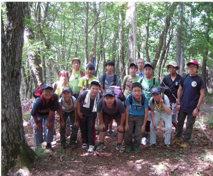
写真7) ハイキングラリー出発前の集合写真

キャンプ中に河口湖の湖畔でハイキングラリーを行いました。地図を読んで指定されたチェックポイントを地図上でみつけ、そこで出題される課題をクリアします。救護の課題では三角巾を使って崖から転落した(想定)隊長の骨折の応手当や担架作りをしたり、通信の課題では救難信号や手旗信号を発信しました。観察の課題ではいつの間にかいなくなった I 隊長の姿を思い出して描くという課題もあり、スカウトたちは「えー！」と困惑の声をあげていたとか。