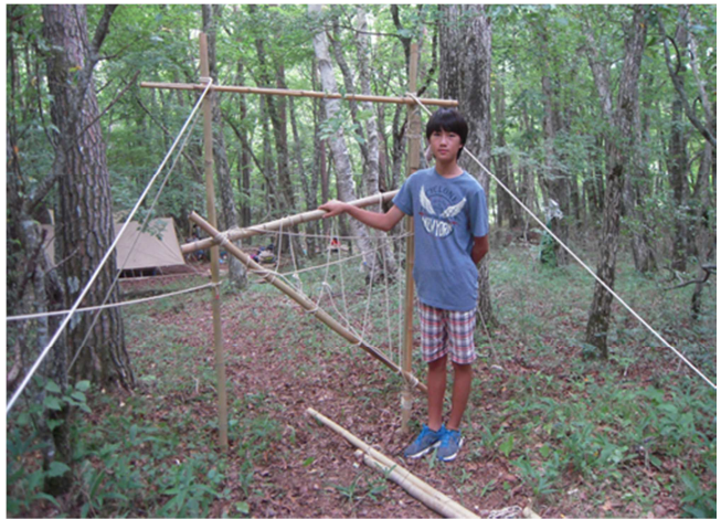
写真3) 班サイトのゲートを完成させたSスカウト

初日と二日目は班サイトを充実させるため、食堂フライ、テント、たちかまどだけでなく、竹と麻ひもで食器置き場やポリタンク置き場、班サイトのゲートも作った班がありました。