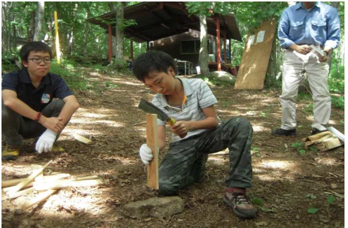
写真4) まき割に挑戦するKスカウト。 後ろにいるのは先輩のIベンチャースカウト

キャンプの安全とスキルアップのプログラムではナタの使い方や砥石の使い方を練習しました。刃物を扱う本人だけでなく、周囲も近づかないようにして自分の身を守る意識が重要です。