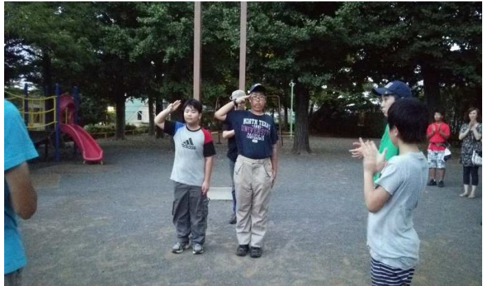
写真13) 優秀スカウトに選ばれたOスカウトとWスカウトターゲットバッジをたくさん取得しました。

撤営に手間取り、バスに乗り遅れないように大急ぎでキャンプ場を出発したスカウト達は、電車を乗り継ぎ無事第4公園に到着。全日程を終えたスカウト達には優秀スカウト賞やサバイバル賞を授与されました。セレモニーが終わった後、みんなで荷物を倉庫に片づけました。本当にお疲れさまでした。