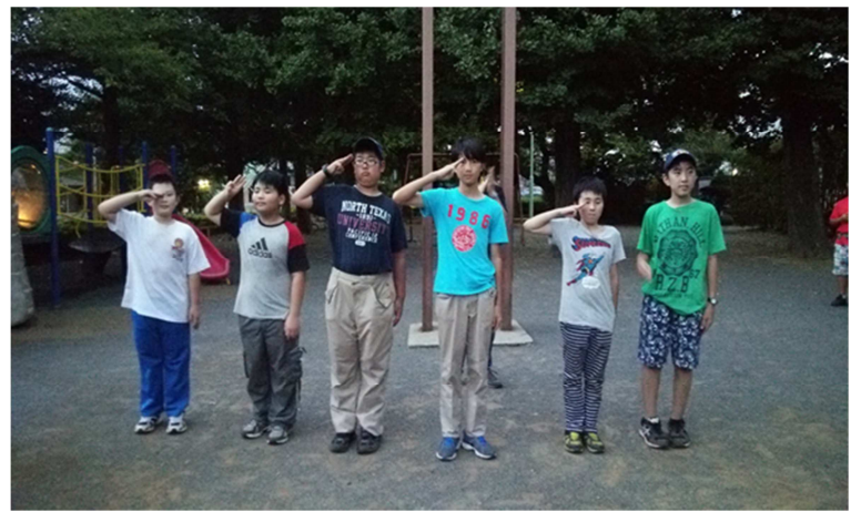
写真14) 6日間の野営をサバイバルしたスカウト達サバイバル賞を授与。

最後の夜はキャンプファイヤ。スカウト達がそれぞれ新組や司会者、ソングマスター、ゲームマスターなどそれぞれの役割を果たしてキャンプファイヤを進めていきました。昨年9月に上進したスカウトたちが乗りまくったスタンプはアドリブがバンバン出て大笑いでした。