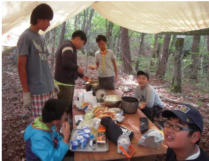
写真1) 食堂フライの下で食事の準備をするスカウトたち