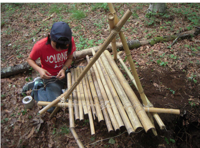
写真2) ポリタンク置き場を要領よく作るI班長