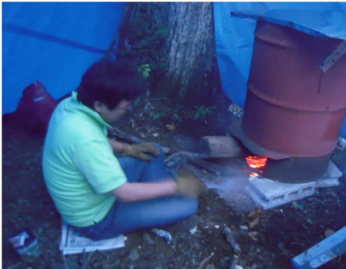
写真6) ドラム缶の水を薪の火で加熱する I 隊長

すずらん荘第3キャンプ場にはドラム缶風呂があります。スカウトたちが夕食を作っている間にブルーシートと竹とロープで「46の湯」の囲いを作り、水を張って、薪の火でお湯を沸かしました。夜プログラムのない日は夕食後のお風呂タイムが楽しみです。