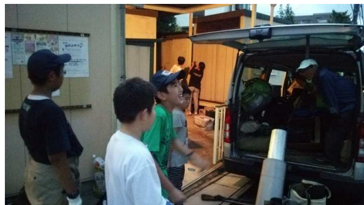
写真15) 後片付けもみんなで頑張りました。頑張ったIスカウトの笑みが印象的。