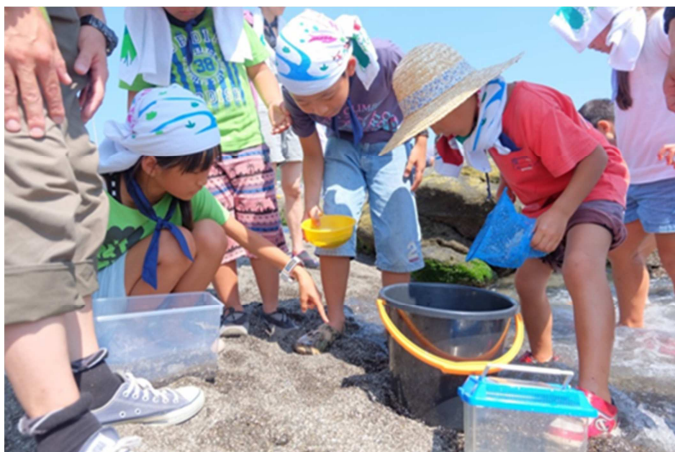
「諸君には、ミニ水族館を作ってもらいます。工夫して、素晴らしい水族館を見せてください。」

みんな、うまくできたかな？ 初日の夕食は、野外料理です。材料は、ジャガイモ、玉ねぎ、にんじん。そうです、カレーです。