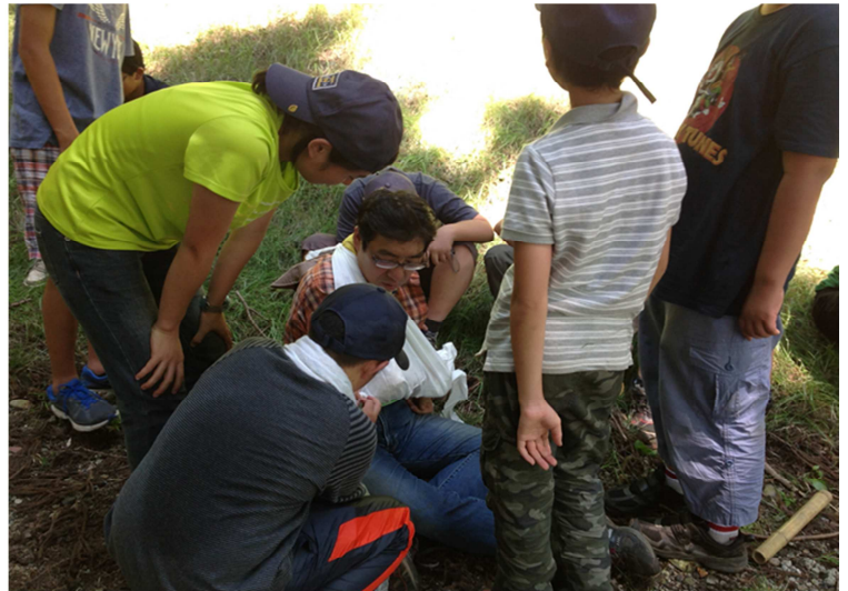
写真8) 骨折した(?) I 隊長を救護するWスカウト