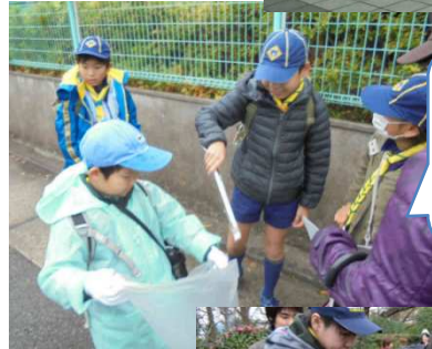
生田駅から団ハウスまで、ゴミ拾い（地域奉仕）を行いました