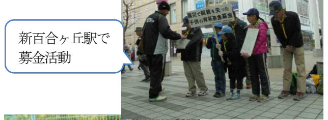
新百合ヶ丘駅で募金活動