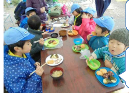
つくたてのもちの味は格別です