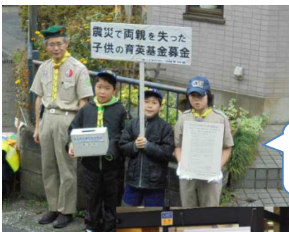
生田駅で募金活動