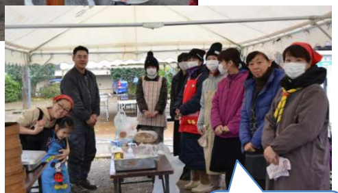
餅つき委員のみなさま