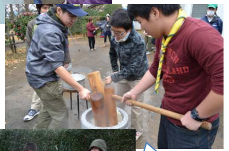
餅つきを体験するスカウト達