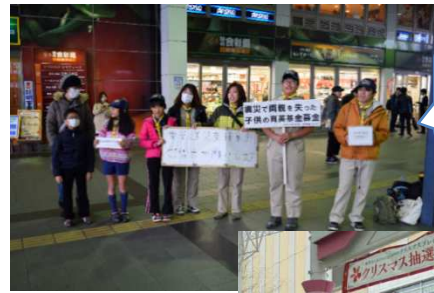
登戸駅で募金活動

募金活動の後、ゴミ拾い（地域奉仕）をしながら三田子ども文化センターに集まり、餅つきを行いました。スカウト達は、臼と杵を使った餅つきを体験し、つくたての餅や雑煮を楽しみました。