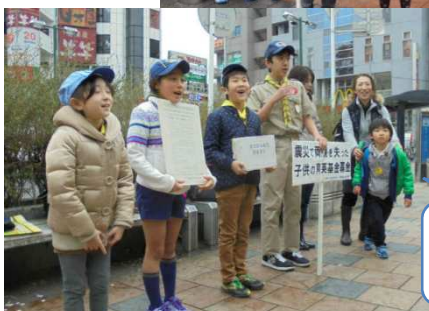
向ヶ丘遊園駅で募金活動